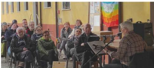
Poleo di Schio, 29 marzo 2026. Il cantautore Beppe Traversa esegue la sua composizione in onore di "Teppa", il cui testo è qui riportato

a Valentino Bortoloso "Teppa" di Beppe Traversa