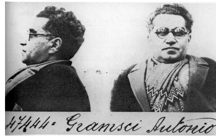
Foto segnaletica di Gramsci di 1933

Gramsci innanzitutto indaga sulla formazione dello Stato unitario e sul Risorgimento e vi ravvisa