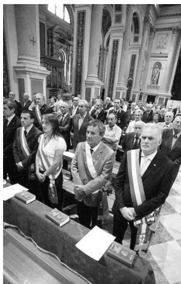
Schio, 7 luglio 2011 - S.Messa in duomo per la vittime dell'Eccidio