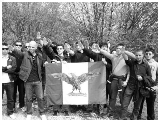
Fotografia pubblicata in Internet e su "Il Giornale di Vicenza" dei giovani nostalgici del fascismo a Lusiana il 25 aprile 2011, nei riguardi dei quali abbiamo inoltrato esposto alla Procura della Repubblica di Bassano del Grappa.

Continuerà pure nell'opera, rivolta in special modo alle nuove generazioni - anche attraverso la Scuola -, che porti ad una seria riflessione su cosa è stato realmente il fascismo e quali effetti disastrosi ha prodotto, sulle nuove forme di fascismo in Italia e in Europa e sul valore dell'antifascismo, vecchio e nuovo.