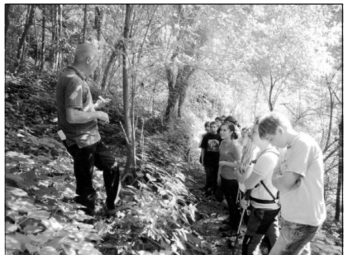
Il Presidente dell'ANPI di Recoaro Terme illustra agli alunni la storia del "Sentiero Partigiano"