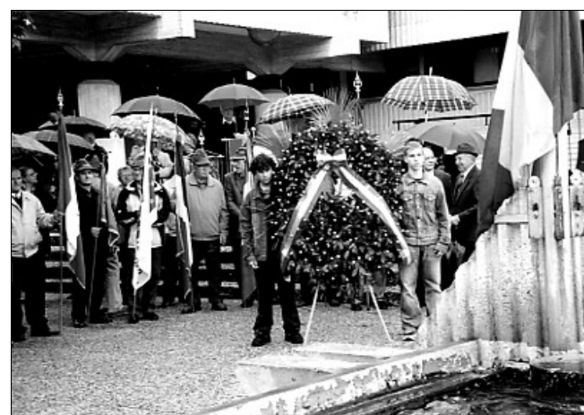
Il 25 aprile 2006 Altavilla Vic animato dai giovani studenti.